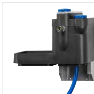
Externe wateropslagtank voor maximaal 40 l/min.