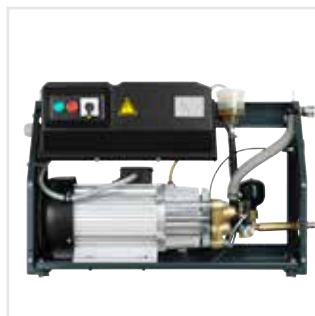
De kast kan snel worden verwijderd voor rechtstreekse toegang tot de motorpomp.