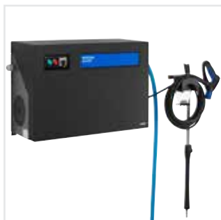
Opslagset voor accessoires, voor lansen, slang, pistool en schuimsproeier.