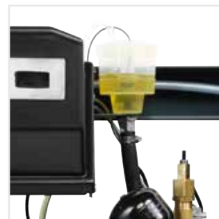
Pompeolietank met oliepeilglas en functie vullen/leggen.